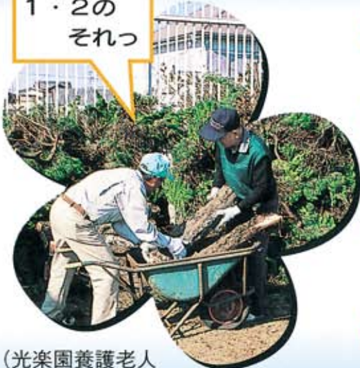
(光楽園養護老人 ホームでの樹木の伐採)