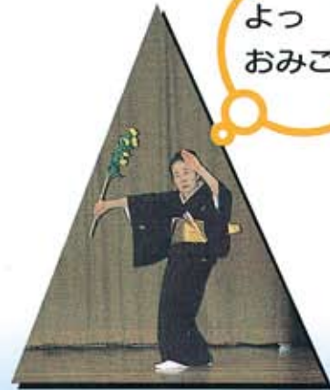
(横芝地区社協ふれあい食事会)