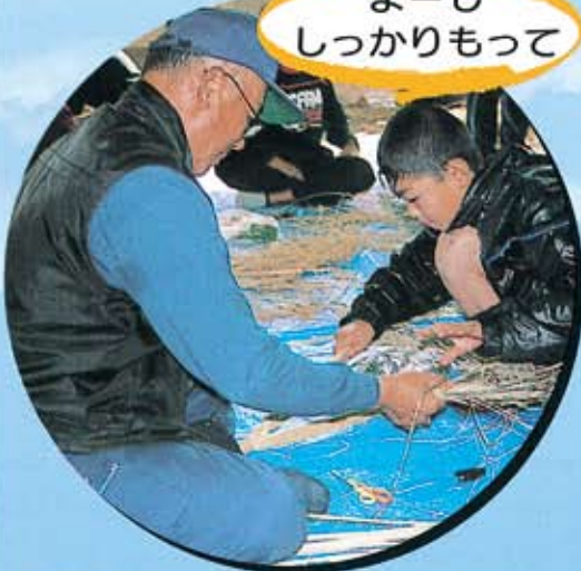
(南条小学校5年生とのしめ縄づくり)