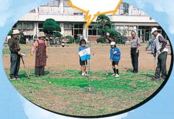
(上堺小学校4年生とのグラウンドゴルフ)