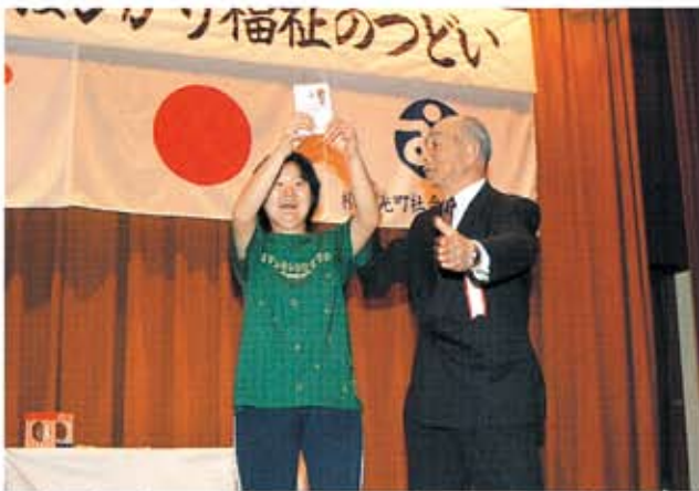
みごとディズニーリゾートペアパスポートチケットをゲット!