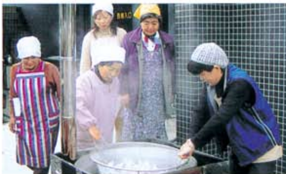
（お米を炊き上げる奉仕団の皆様）

また、午後からはAED（自動体外式除細動器）を用いた心肺蘇生法の訓練をおこないました。心肺停止状態の方に對して、心肺蘇生法を施しながらAEDを使用し電気ショックを行い、蘇生を試みる訓練です。等身大の人形を使用し指導員の指示に従い練習を繰り返しておこないました。迅速な対応と一次救命処置の重要性を体験することができ、有意義な一日となりました。