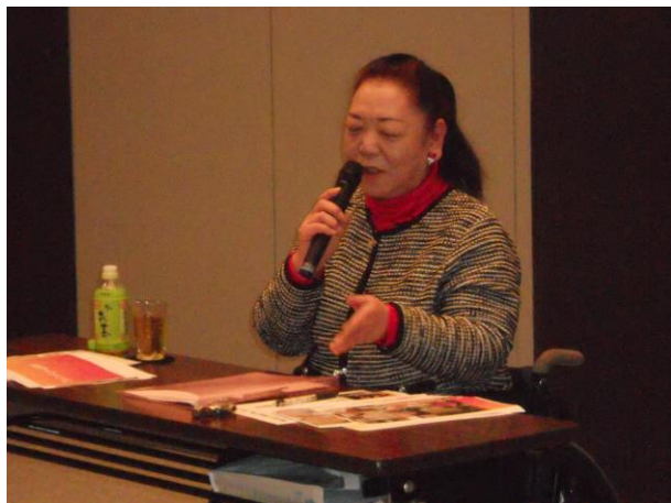
講演をする木内氏