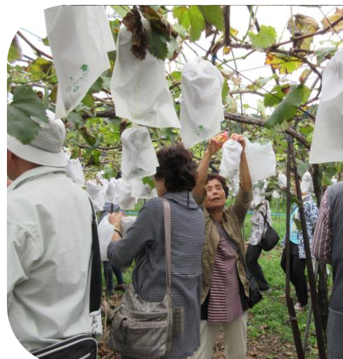
大平山ぶどう団地